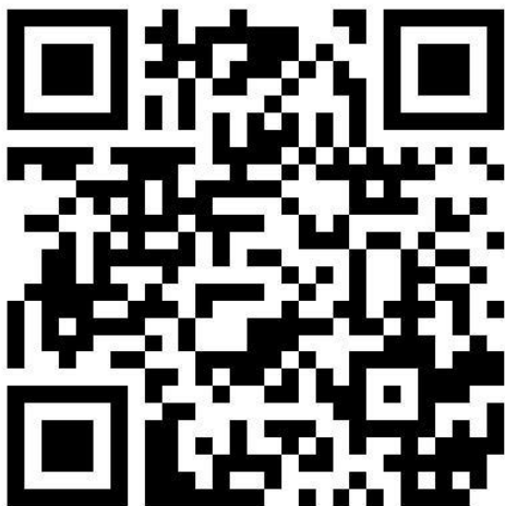
QR-Code zur Nestbau Homepage